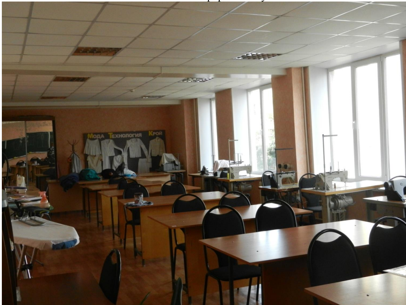
Фото 9 – кабинетная форма обслуживания