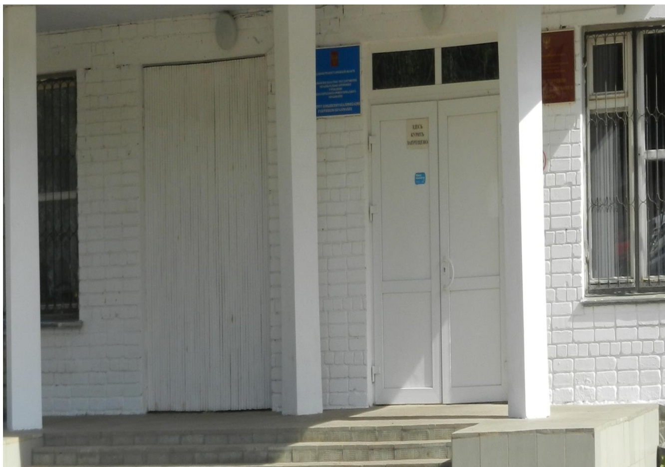
Фото 3,4. Описание: Входная дверь и входная площадка.