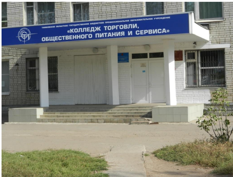
Фото 1, 2. Описание: Вход в корпус и наружная лестница.