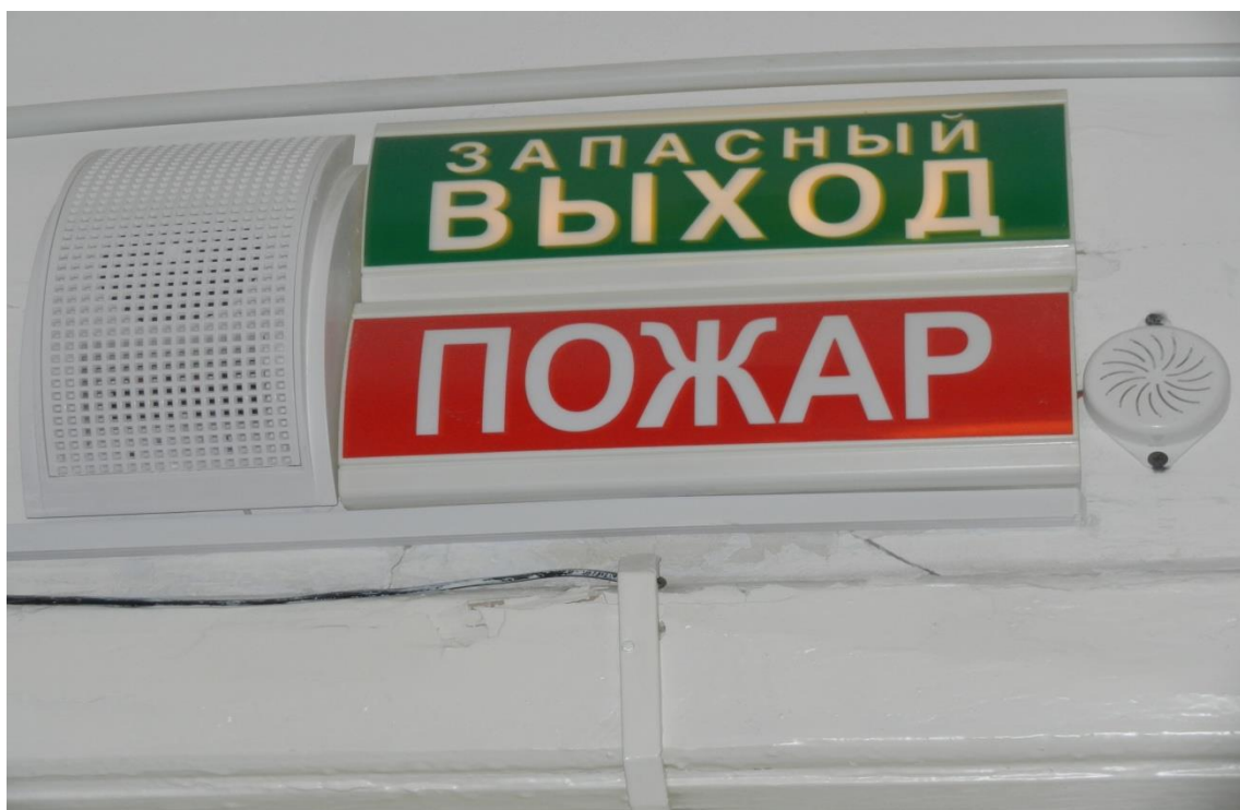
Фото 12 – Акустические средства