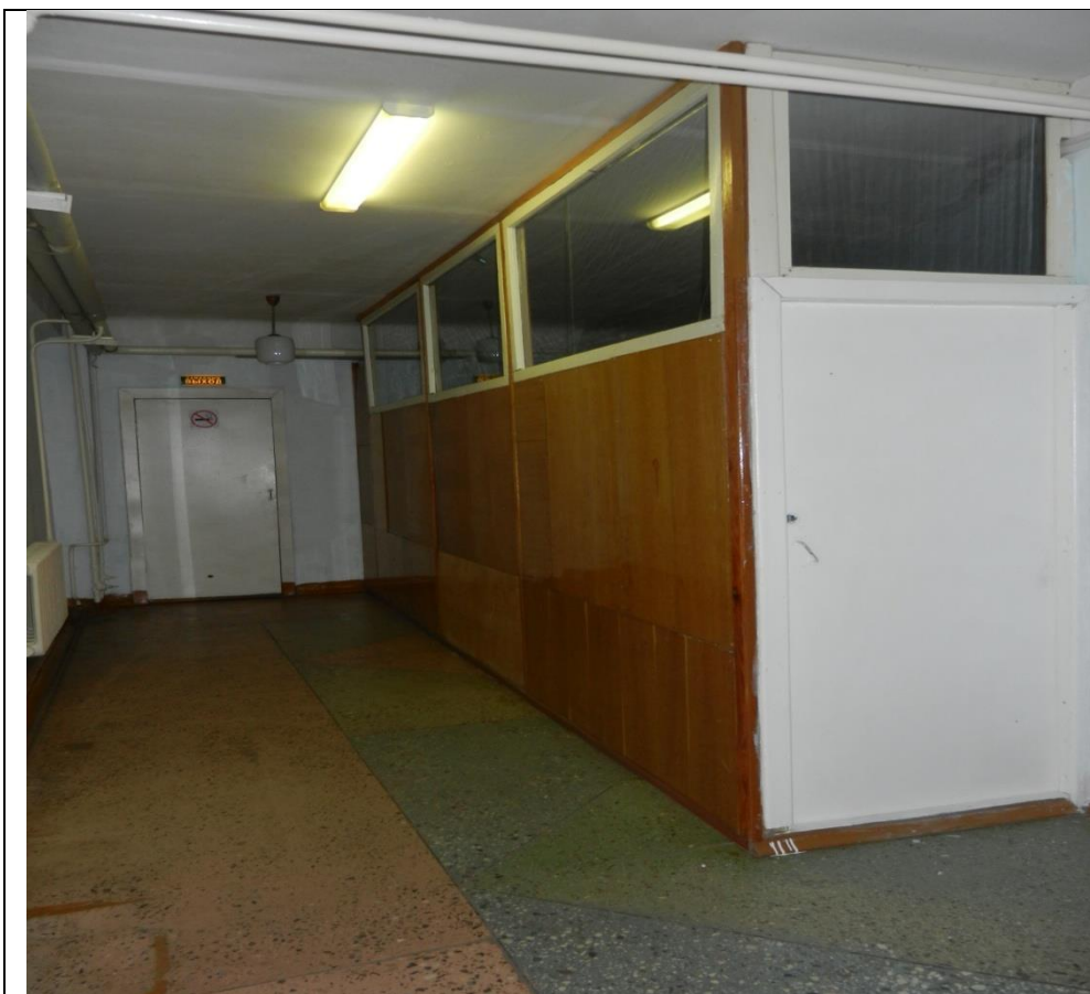
Фото 11 – Гардероб