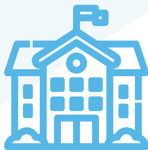
Томский Государственный Университет