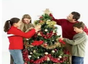
Празднование Нового года