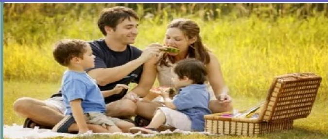
Пикник на природе