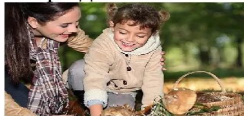
Поход за грибами